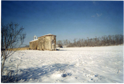
L'église Notre-Dame-de-la-Nativité Sous la neige