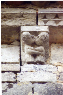
Modillons sculptés "couple d'amoureux"