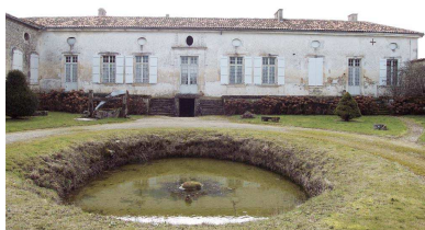
Le logis du breuil Malmaud