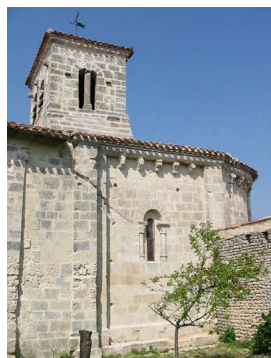
Eglise XII siècle