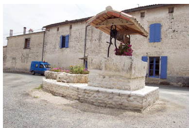
Puits du Breuil